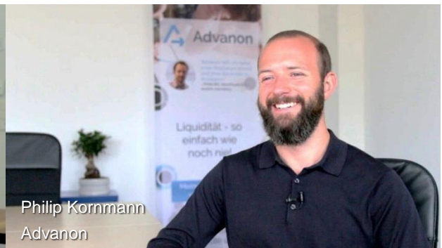
Filmstills von Interviews aus FINTECH MADE IN SWITZERLAND