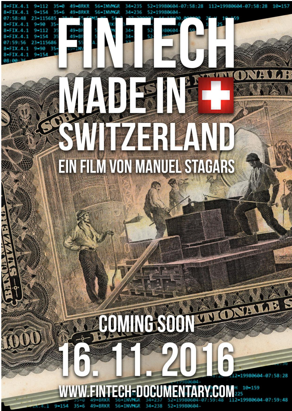
Poster des Films